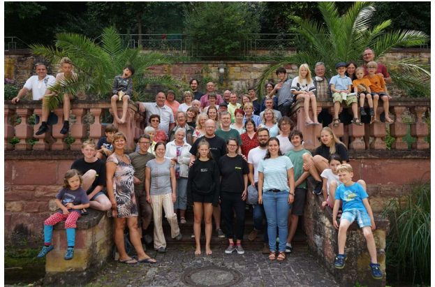
Gemeinderüstzeit in Triefenstein