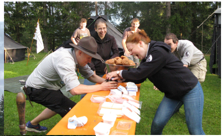
Sommerlager der Pfadfinder bei Innsbruck in Österreich