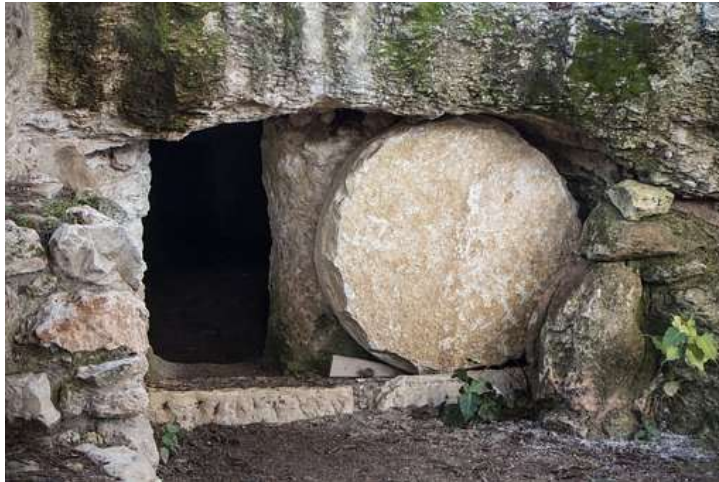
Nachbildung eines Rollsteingrabes

Der Blick auf den Gekreuzigten, der unsere Schuld auf sich genommen hat, darf weitergehen zum offenen Grab und zu dem Auferstandenen!